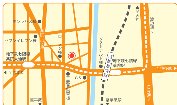
本校案内図 (※講座会場は別となります)